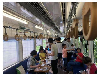
プログラミングトレイン

イアマスこどもだいがくの一部として、体験拡張環境プロジェクトを中心としたメンバーにより、子供向けのプログラミングワークショップを樽見鉄道内で行った。Micro:Bit を使い、日本総合ビジネス専門学校と協力し、Micro:Bit 用のセンサーやモーターなどを入れた接続用のボックスを制作し、それらをつないでいくことでインタラクティブなプログラミングが行えるような環境を構築した。列車の移動すること、閉じた空間であることを生かしたインタラク션을プログラミングしてもらうことを狙っていたが、短時間ではそこまでは実現できず、用意したセンサーやモーターによるモジュールを使ったアイデアを実現することまでだったが、参加した小学生・中学生は各々ユニークなものを作ってくれた。